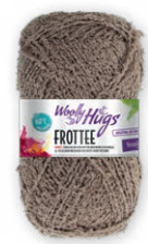
Farbe Nr. 07 leinen