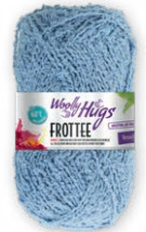
Farbe Nr. 56 hellblau