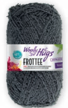
Farbe Nr. 97 dunkelgrau

Art. Nr. 27 2100 A60 | Hersteller Wolle: Langendorf & Keller GmbH, D-79774 Albruck | Modelle, Anleitungen: VeronikaHug.com