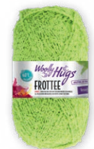
Farbe Nr. 74 apfel