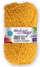
Farbe Nr. 22 gold