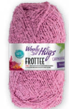
Farbe Nr. 35 himbeer